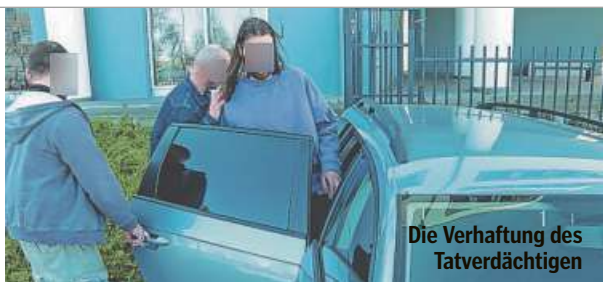
Die Verhaftung des Tatverdächtigen

Mittlerweile habe die Haspa ihren Angaben nach ihr Sicherheitskonzept überarbeitet und angepasst. Weiter zu dem Fall äußerten sich die Anwälte nicht, baten um Bearbeitungszeit, bevor man eine finale Erklärung abgeben will. Ein Urteil wird im Juni erwartet.